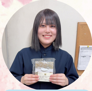
かつや名四弥富店

フコ店長 オープンから今までありがとうございます ございませう。責任感を持って、 仕事ぶり、大変助かっています。 就職しても頑張ってください。