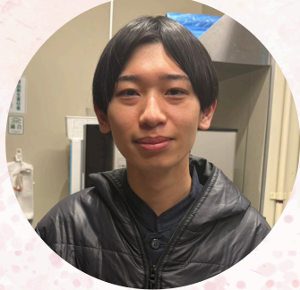
かつや イオンモール木曽川店

卒業おめでとう!! ここでの経験も今後活かして さっさと新天地でのご活躍を期待しています!!