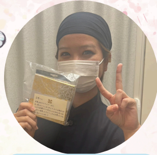
かつや美濃加茂店