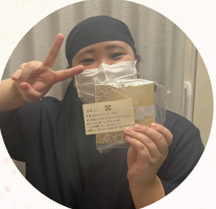
かつや美濃加茂店