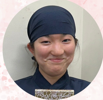
かつや豊川御油店

卒業おめでとうございます!! これからも期待しています! 引き継ぎ力を貸してください! 成長を楽しみにしています!