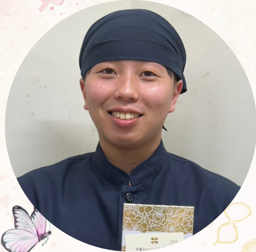
かつや豊川御油店

卒業おめでとうございます! 土日のランチを積極的に 入ってくれて 2年間ありがとうございました。