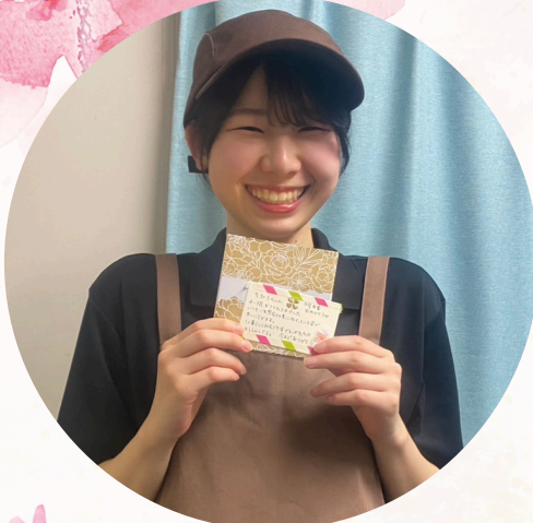
コマダ珈琲店155線常滑店

あっくんへ ご卒業おめでとうございます！ 初めて会った時がわからないやさしさで、お世話になりました！ これからますます頑張ってください！ またコマダにも遊びに来てください！ あっくんが先陣にならぬようにがんばります！ 今までありがとうございました！