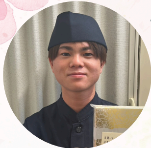
かつや美濃加茂店