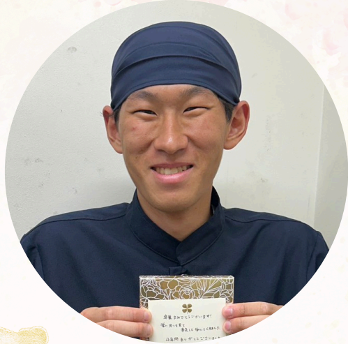
かつや豊川御油店

卒業おめでとうございます! 深夜や積極的に意見を提示し お一人一線でご活躍してくれました。 4年間ありがとうございました