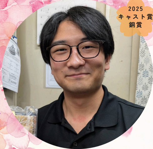
コマダ珈琲店多治見住吉店

あっくんへ ご卒業おめでとうございます！ 初めて会った時がわからないやさしさで、お世話になりました！ これからますます頑張ってください！ またコマダにも遊びに来てください！ あっくんが先陣にならぬようにがんばります！ 今までありがとうございました！